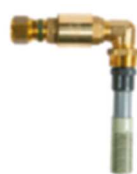
5 Diffusörarmatur inkl. backventil